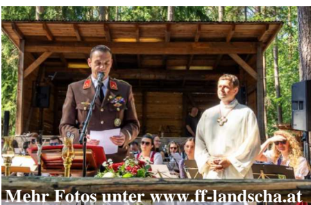
Mehr Fotos unter www.ff-landscha.at